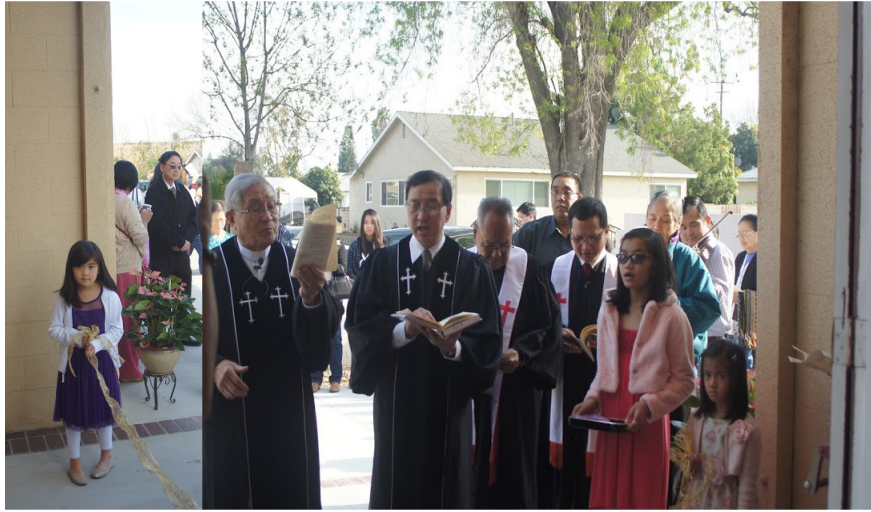
ဗိမာန်တော်သစ် အနုမောဒနာ ဖွင့်ပွဲ အခမ်းအနား

မြန်မာခရစ်ယာန်မိသဟာယအသင်းတော် (Burmese Christian Fellowship) ၏ ဗိမာန်တော်သစ် အနုမောဒနာပြုခြင်းအခမ်းအနား နှင့် ဝတ်ပြုကိုးကွယ်ခြင်း အစီအစဉ်ကို ၂၀၁၆ ဖေဖော်ဝါရီလ ၁၇ရက် တနင်္ဂနွေနေ့ မွန်းလွဲ ၂:၀၀ နာရီ အချိန်တွင် ၊ ဗိမာန်တော်တည်ရှိရာ 1337 Farmstead Ave. La Puente, CA 991475 ၌ ကျင်းပခဲ့ပါသည်။