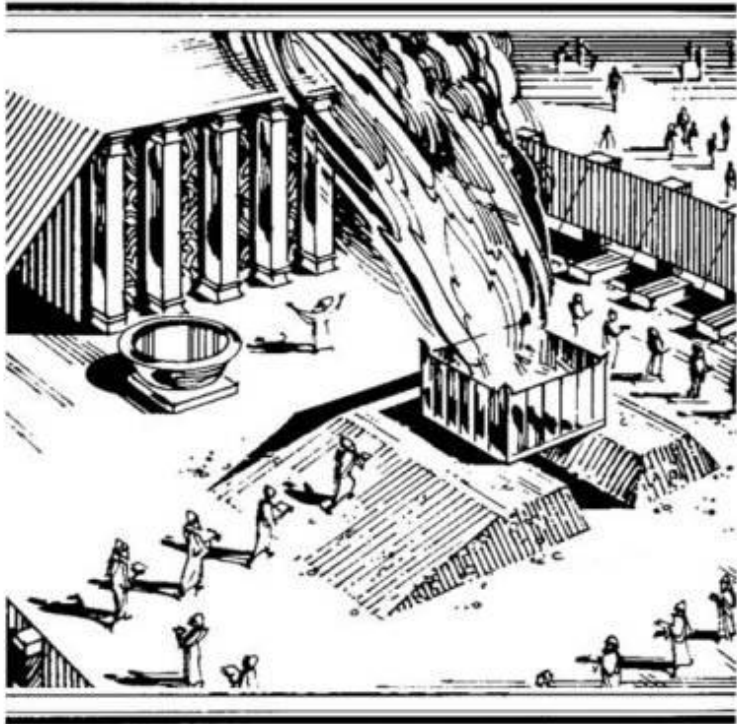
အပြစ်ပြေရာယဇ်ကောင်ပူဇော်ပုံ။

ပဋိညာဉ်ဟောင်းခေတ်တစ်လျှောက်လုံး အသေခံသွားတဲ့ ယဇ်ကောင်အားလုံးဟာ ပဋိညာဉ် သစ်၌ ကြွလာမဲ့ ဘုရားသခင်၏သားတော်ယေရှုက အပြစ်ပြေရာယဇ်နေရာမှာကိုယ်စားအသေခံကြောင်း ပုံဆောင်ခြင်းဖြစ်တယ်။