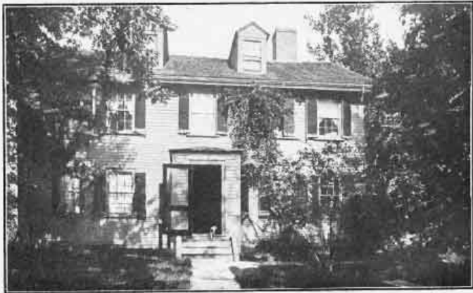
WHERE THE FOUNDER WAS BORN