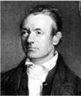
ဆရာကြီးယုဒသန်ပုံ