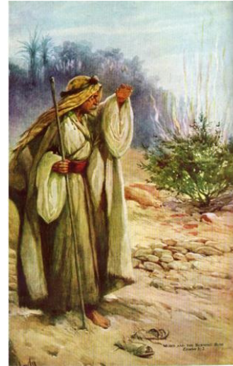
ပုံ-မောရှေနှင့်မီးလောင်နေသောခုံ