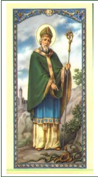
St. Patrick Picture