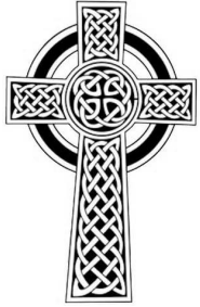
Irish Celtic cross

လာသည်နှင့်အမျှ Patrick ၏ဘဝဖြစ်စဉ် သည်လည်းဘဲ ပို၍ တိုး၍ ချဲ့ထွင်ခြင်း ခံရသည်မှာ မဆန်းပါ။ အံ့ဩဖြစ်စရာ မလိုပါ။ စိတ်လှုပ်ရှားကြစေသော ပုံပြင်များအားဖြင့် ရာဇဝင်သမိုင်းကို မှတ်မိစေခြင်းသည် Irish လူမျိုးတို့၏ နေ့စဉ်အသက်သာ၏ တစ်စိတ်တစ်ဒေသပင် ဖြစ်ပါသည်။