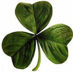
The three-leaved Shamrock