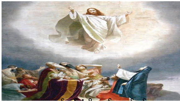
ကောင်းကင်ဘုံသို့ဆောင်ယူတော်မူစဉ်

ထိုနောက် တပည့်တော်တို့ကို ယေရုရှလင်မြို့ပြင်၊ ဗေဓန်ရွာတိုင်အောင် ဆောင်သွား တော်မူပြီးမှ၊ လက်တက်ချီ၍ ကောင်းကြီးပေးတော်မူ၏။ ထိုသို့ ကောင်းကြီးပေးတော်မူစဉ်တွင် တပည့်တော်တို့နှင့်ခွာ၍ ကောင်း ကင်ဘုံသို့ ဆောင်ယူခြင်းကို ခံတော်မူ၏။ တပည့်တော်တို့သည် ကိုယ်တော်ကို ပြင်ပကိုးကွယ်ပြီးမှ အလွန်ဝမ်းမြောက်ဝမ်းသာခြင်းနှင့် ယေရုရှလင်မြို့သို့ပြန်သွား ကြ၏။ ဘုရားသခင်ကို အံ့သြချီးမွမ်းလျက် ဝိမာန်တော်သို့ ရောက်မြဲရောက်ကြ၏။ □