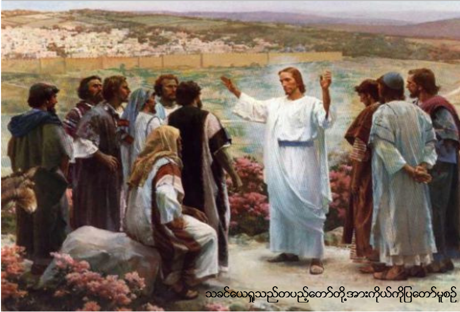
သခင်ယေရှုသည်တပည့်တော်တို့အားကိုယ်ကိုပြတော်မူစဉ်