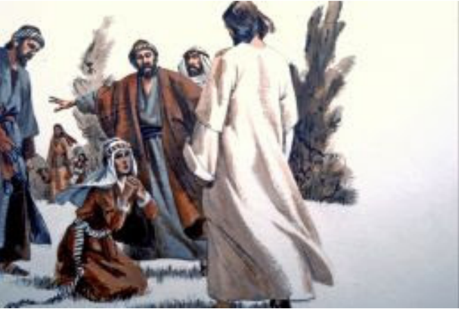
Jesus and Canaanite woman

ထိုအခါ ... မိခင်များသည် မိမိတို့၏ စိတ်ဆန္ဒ အလိုရှိသည်အတိုင်း ဖြစ်ပါလိမ့်မည်။ ☐☐