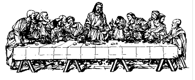
ခရစ်တော်၏ညစာစားပွဲပုံ

ထိုကြောင့် ပွဲတော်မင်္ဂလာ အစည်းအဝေးသို့ မဝင်မှီ မိမိကိုယ်ကို စစ်ကြောသန့်ရှင်း စေပါ။ ခရစ်တော်၏ပွဲတော်ကို ဝင်စားရသောအခွင့်သည် မင်္ဂလာအပေါင်းနှင့် ပြည့်စုံ ပါ၏။ ။