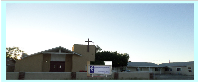
မြန်မာခရစ်ယာန်မိတ်သဟာယအသင်းတော်၏ ချီးမွမ်းဝတ်ပြုကိုးကွယ်ရာဗိမာန်တော်ပုံ၊

Worship Place ... 1337 Farmstead Ave. La Puente, CA 91745