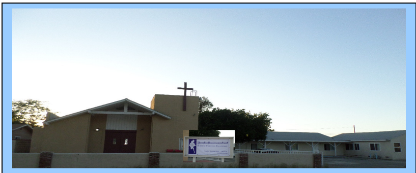
မြန်မာခရစ်ယာန်မိတ်သဟာယအသင်းတော်၏ ချီးမွမ်းဝတ်ပြုကိုးကွယ်ရာဗိမာန်တော်ပုံ၊ Address ... 1337 Farmstead Ave. La Puente, CA 91745

Special Occasion ... The Very First Service Date ... October 4, 2015 at 2:00 PM Worship Place ... 1337 Farmstead Ave. La Puente, CA 91745